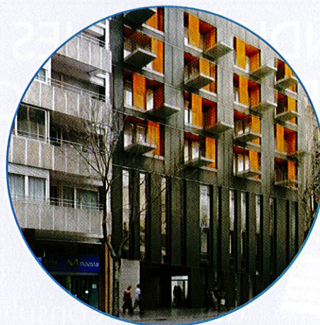
Pemio a la Promoción RESIDENCIAL más Sostenible 2011 Viviendas para Mayores Cibeles Barcelona Exe Arquitectura Barcelona Promovida por el Patronat Municipal de l'Habitatge de Barcelona

En este contexto, la labor de promotores y constructores cobra una especial relevancia, ya que desempeñan un papel prioritario en la puesta en marcha de iniciativas de eficiencia energética, integración arquitectónica, soluciones tecnológicas e implantación de las energías limpias.